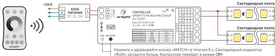
Рисунок 1. Схема подключения контроллера SMART-TUYA-BLE-MULTI-SUF